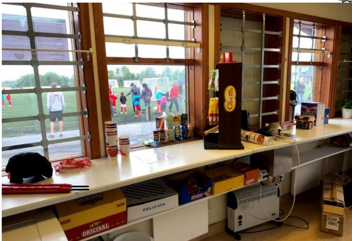
Alla produkter hittar ni på hyllorna under bänken eller i kyl och frys. Ytterligare volymvaror finns även i kiosk-/föreningsförrådet, där även Muurikan, bord och tält finns.